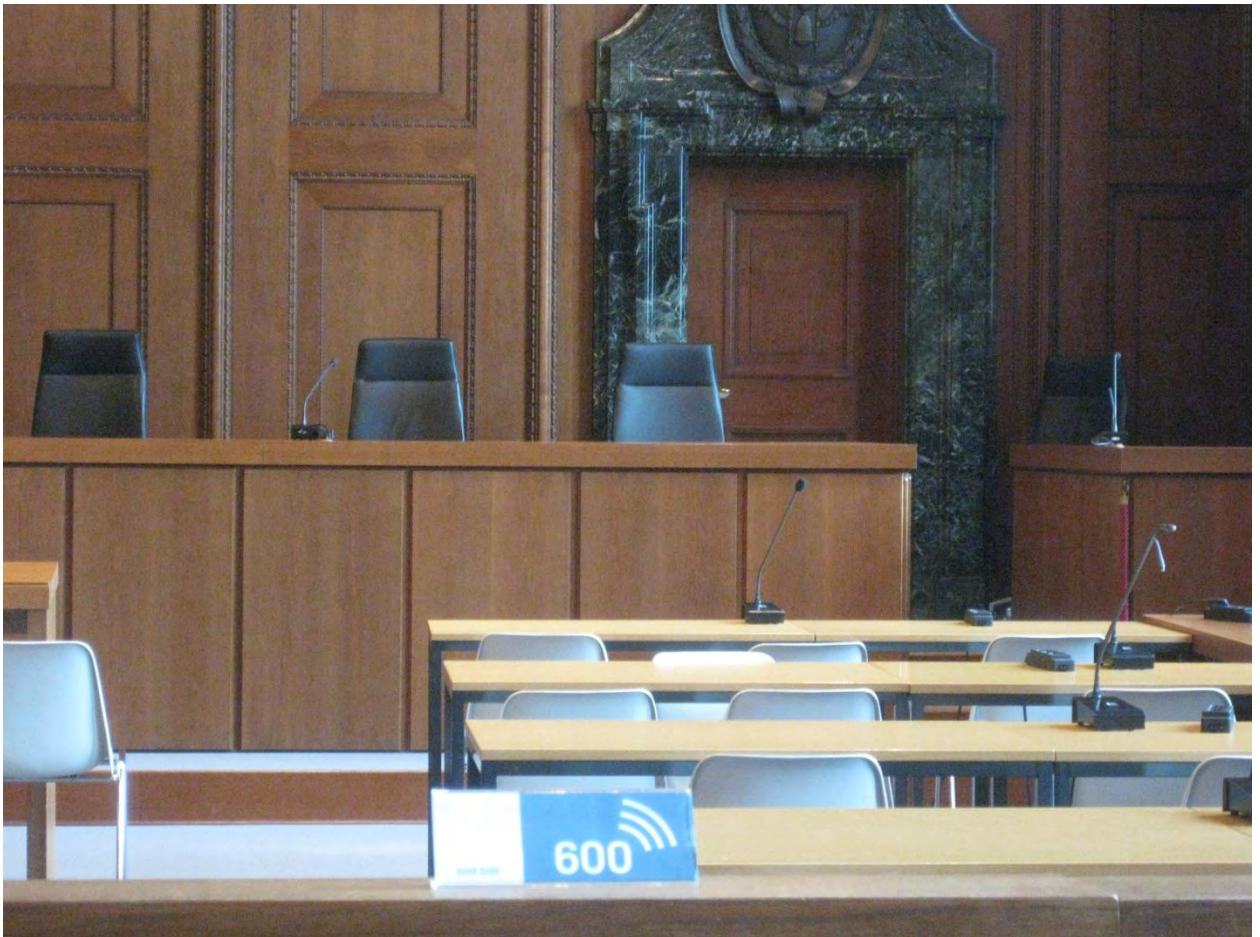
Рисунок 12. Нюрнберг, Дом Правосудия. Зал 600

В центре Нюрнберга располагается Нюрнбергский замок. Этот замок довольно большой по площади. Гуляя по замку можно увидеть много интересного (Рисунок 13 ).