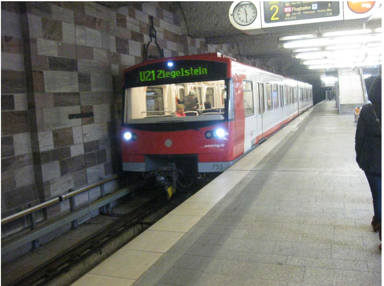
Рисунок 15. Нюрнбергский метрополитен