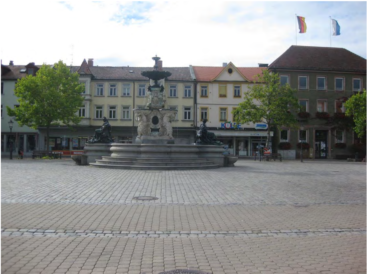
Рисунок 2. Площадка напротив административного корпуса

Также, большое количество иностранных студентов со всего мира учатся или же проходят практику в ФАУ. Университет участвует в европейской программе по обмену студентами ERASMUS, что подразумевает большое количество студентов со всей Европы. Больше количество таких студентов приезжают на один-два семестра с целью усовершенствования немецкого языка, но практически все из них обладают высоким уровнем английского языка. Так что проблем в плане общения не бывает.