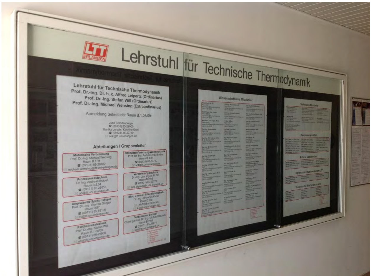
Рисунок 10. Стенд с контактной информацией сотрудников ЛТТ

На Рисунок 11 показаны фотографии моторной группы (слева), моя экспериментальная установка (справа). Экспериментальная установка посвящена нахождению ламинарной скорости горения различных видов (био-) топлива.