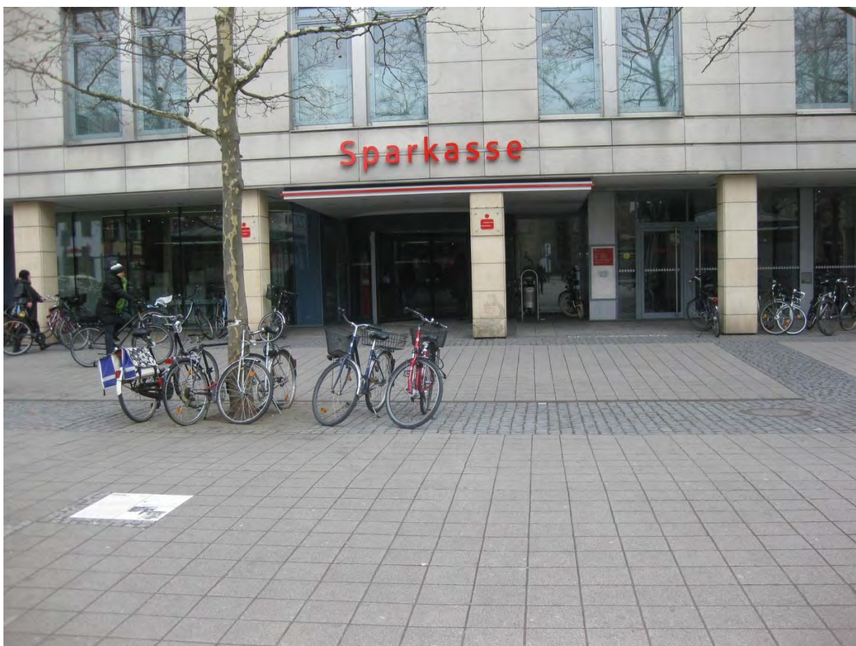
Рисунок 5. Главный отдел Sparkasse

Завести банковский аккаунт можно в любом отделе Sparkasse. Банковская карточка дается не сразу, а присылается по почте через 2-3 недели. Так что снять стипендию за первый месяц сразу не удастся. Поэтому, необходимо привезти некоторую сумму денег из России. В первое время, денег может уходить немного больше, чем обычно (возможно, Вы захотите купить велосипед, бытовые приборы, проездной на автобус); лучше всего, чтобы в запасе было не меньше 1000 евро.