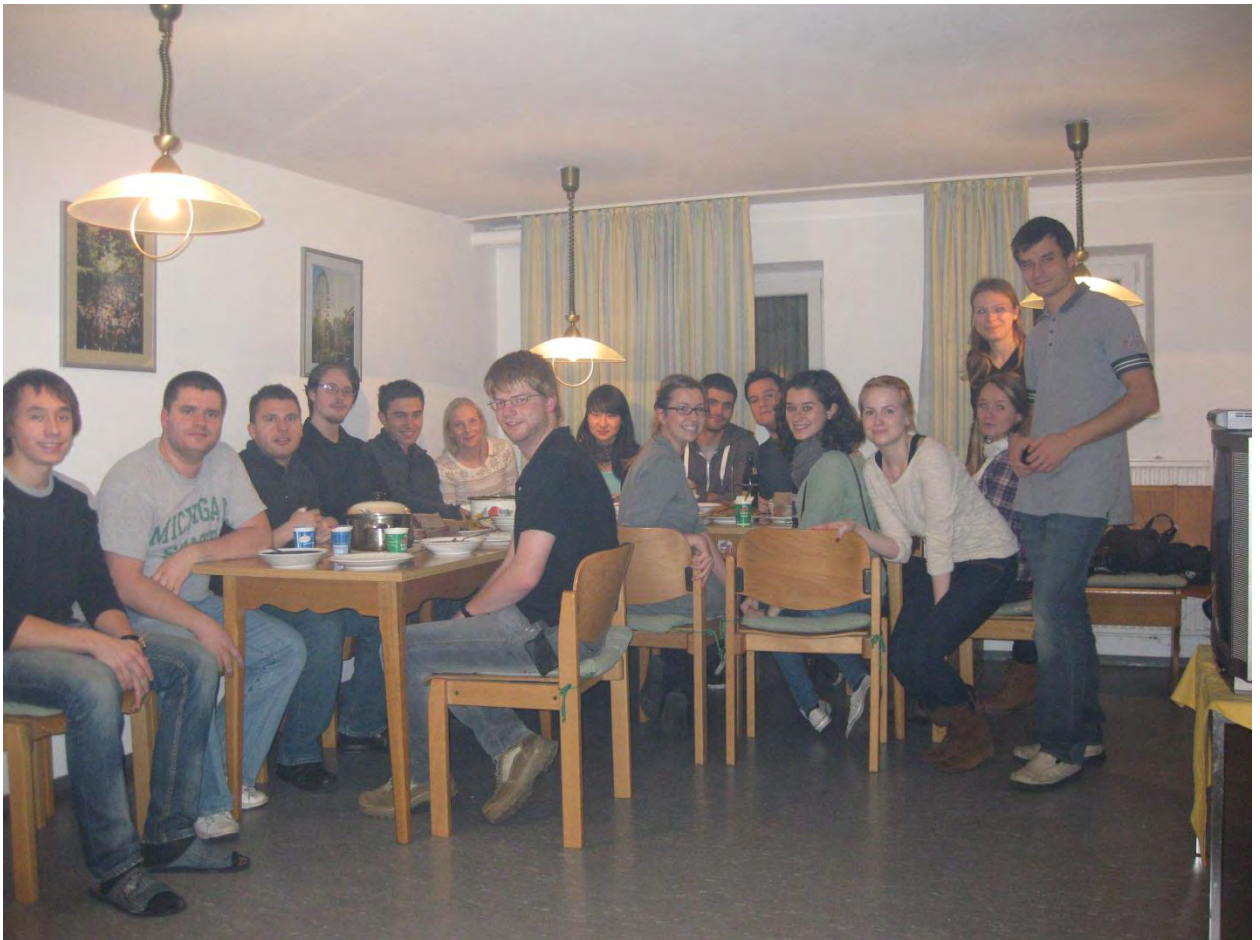
Рисунок 16. Русский ужин

Относительно меня, хочу сказать следующее. Эта стажировка предоставила мне большой опыт в проведении экспериментальной научной работы, сильно укрепила мои знания по английскому языку, предоставила базовые знания немецкого языка и, конечно же, помогла найти много хороших друзей с различных уголков нашей планеты.