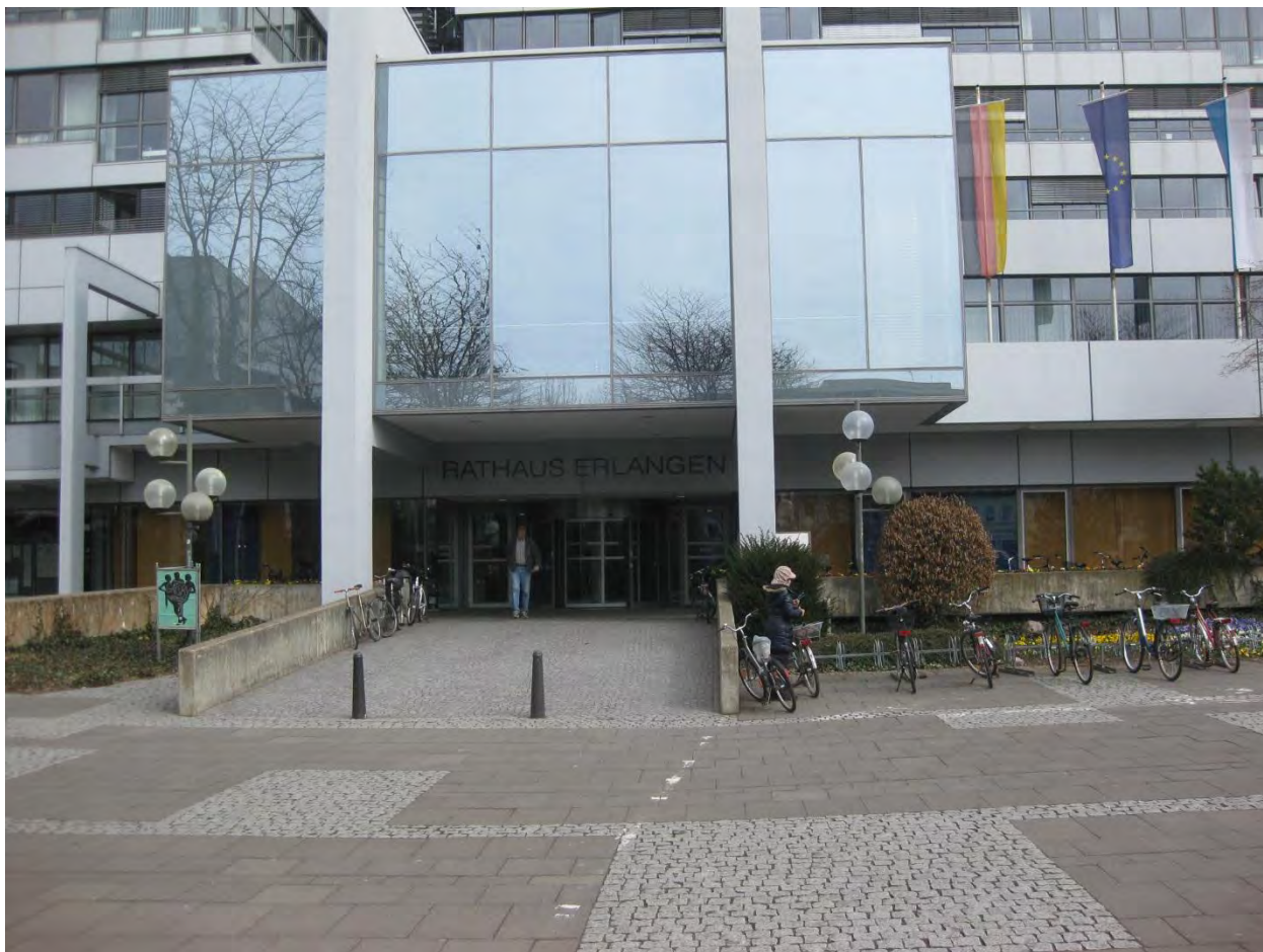
Рисунок 4. Rathaus Erlangen

Первым делом, нужно пройти регистрацию в самом городе. Для этого необходимо пойти в Rathaus .