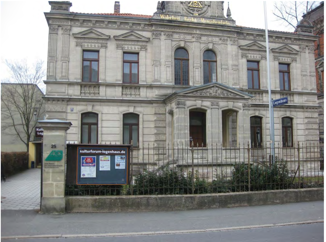
Рисунок 6. Офис страховой компании АОК

В университете есть несколько библиотек. Центральная библиотека (Рисунок 7) находится в трех минутах от главного вокзала. Библиотека работает с раннего утра и до полуночи. В ней находятся компьютеры с выходом в интернет и Wi-Fi, доступ к которым осуществляется через личный логин и пароль студента. Они выдаются после процесса регистрации в университете вместе с FAU-Card (карта студента).