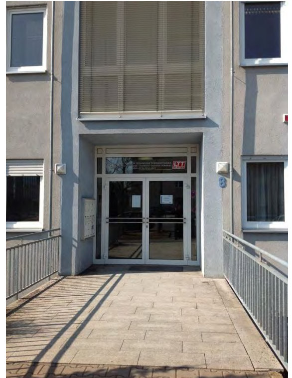
Рисунок 8. Здание ЛТТ и главный вход в отдел

Коллектив отдела очень дружелюбный, и практически все сотрудники владеют очень хорошим знанием английского языка. На Рисунок 9 представлена фотография со всеми сотрудниками отдела ЛТТ.