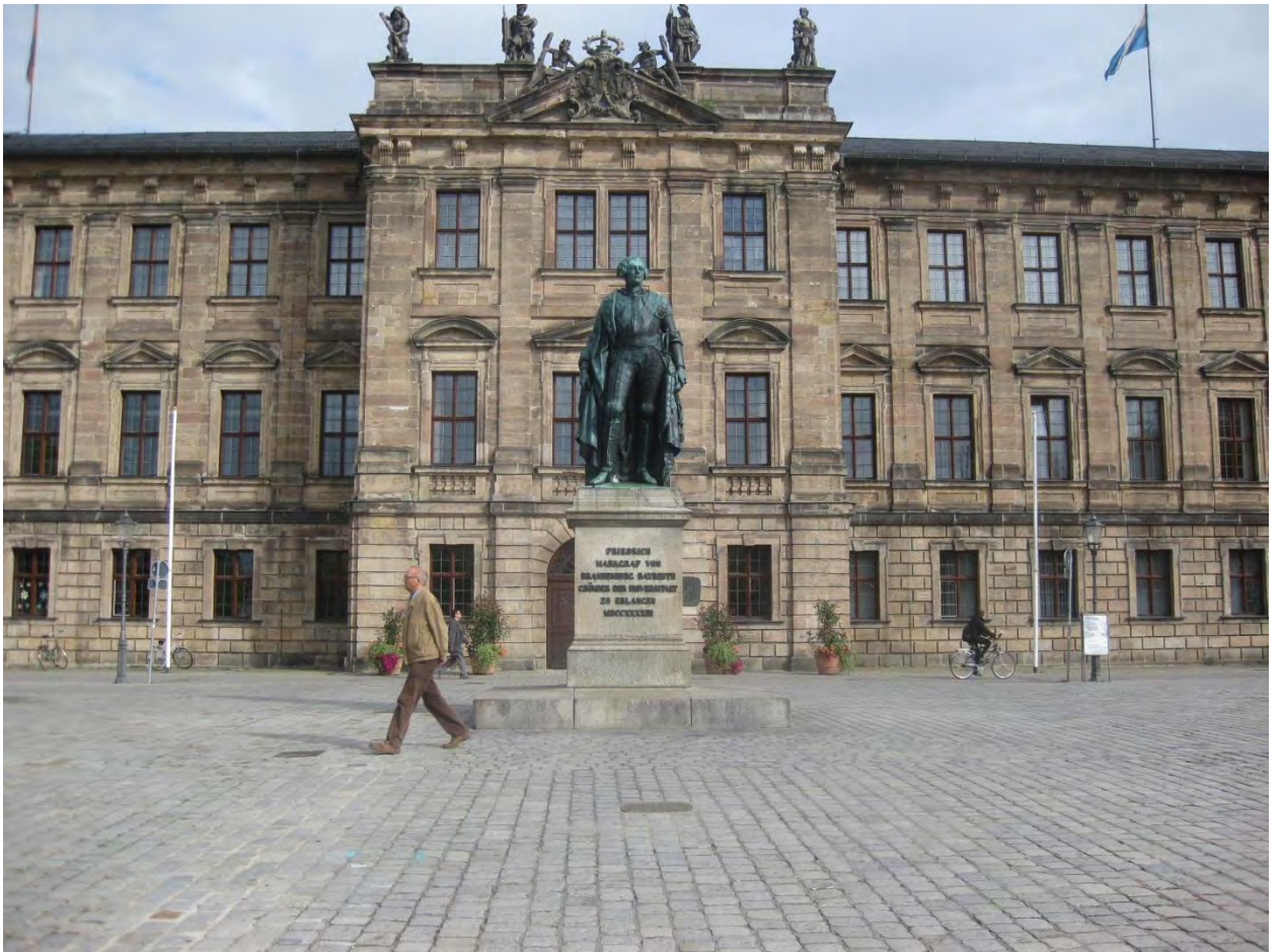
Рисунок 1. Административный корпус ФАУ