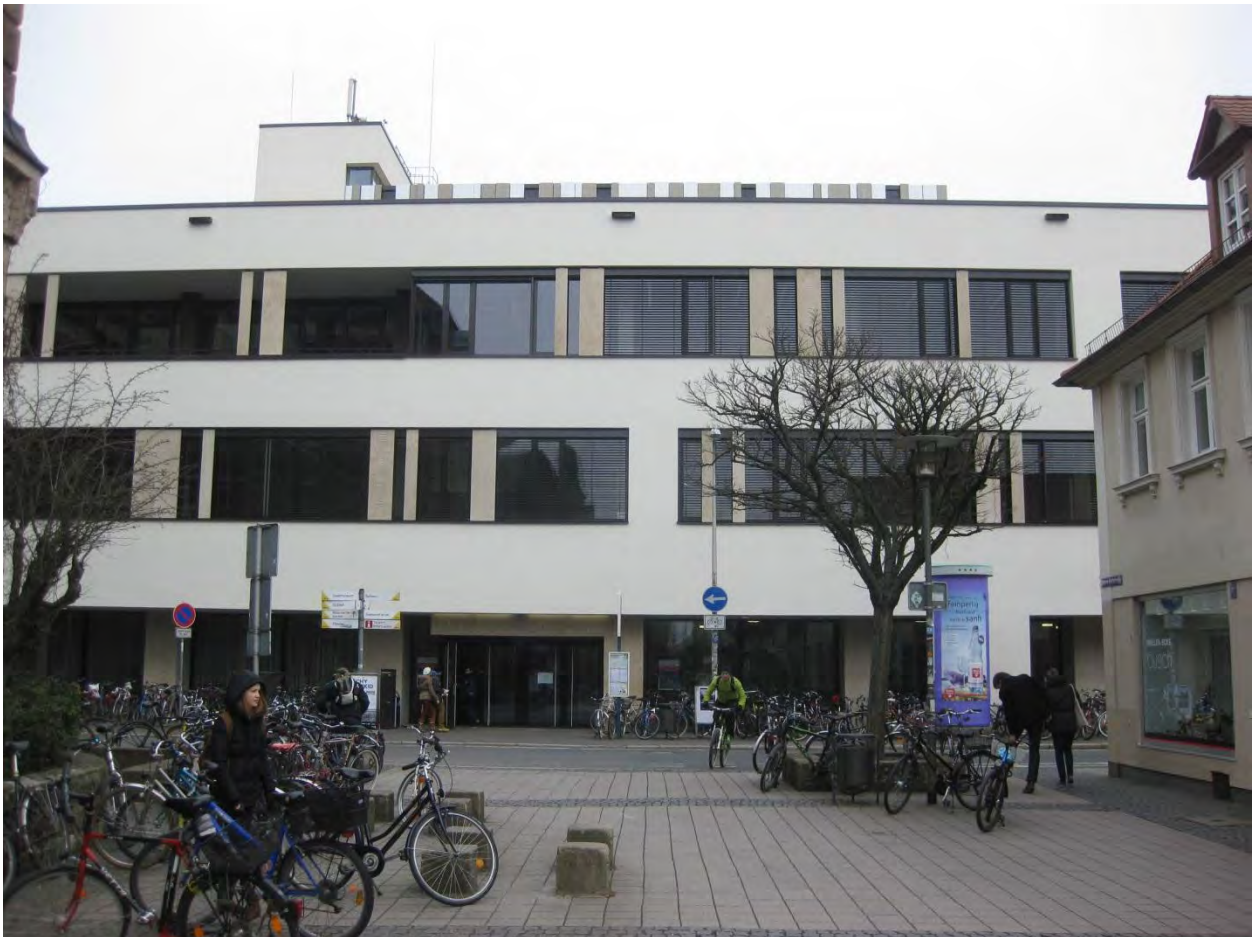
Рисунок 7. Центральная библиотека университета

Повторюсь, что процесс регистрации в городе и в университете, процесс получения банковского аккаунта, медицинской страховки, карты оплаты для столовой проходит очень быстро с представителями международного отдела университета, если прийти в назначенное время и в назначенное место.