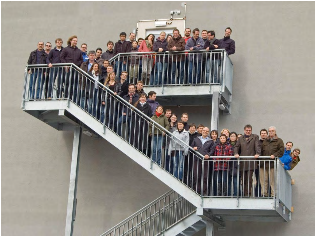
Рисунок 9. Сотрудники отдела ЛТТ

При входе в здание есть стенд, на котором указаны все контактные данные сотрудников. Стенд показан на Рисунок 10. Зная имя своего будущего руководителя, можно легко найти номер его кабинета на данном стенде.