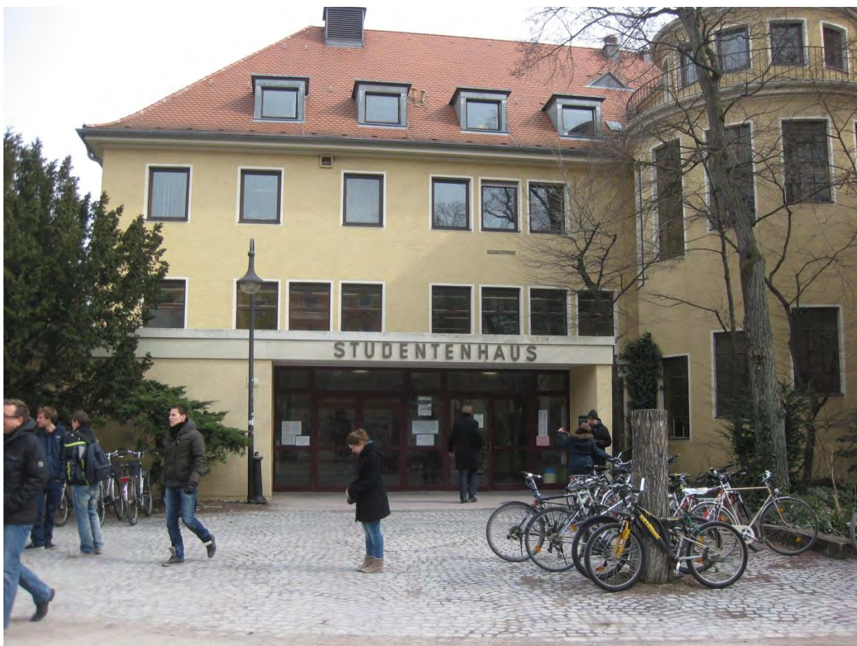
Рисунок 3. Студенческая столовая

Университет включает две студенческие столовые: одна находится в центре (Рисунок 3), вторая на территории технического факультета. Эти столовые носят название “Mensa”. Цены примерно такие же, как в столовых МЭИ. Для оплаты используется специальная карта, которую можно приобрести только в центральной столовой (Рисунок 3).