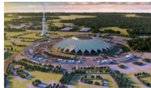
Стадионы для ЧМ по футболу