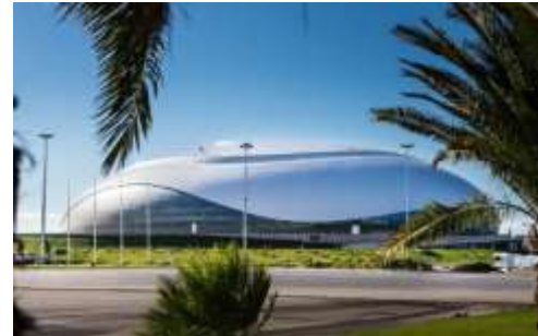
Большая ледовая арена, г. Сочи