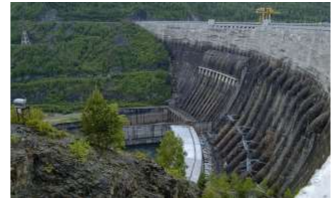
Саяно-Шушенская ГЭС, г. Саяногорск