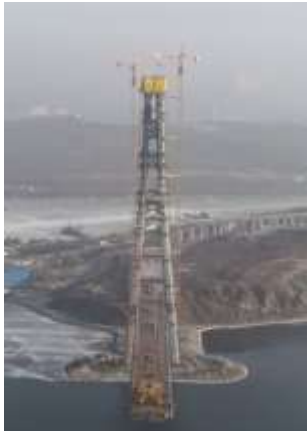
Русский мост, о. Русский