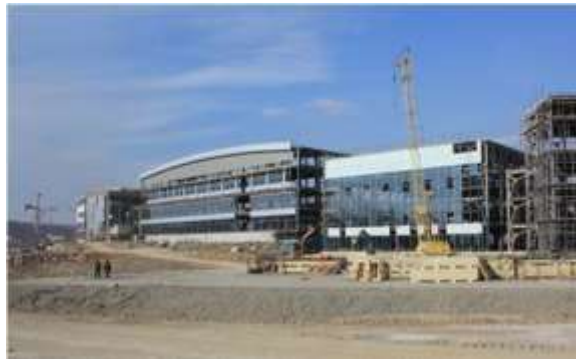
Здание Дальневосточного федерального университета, г. Владивосток