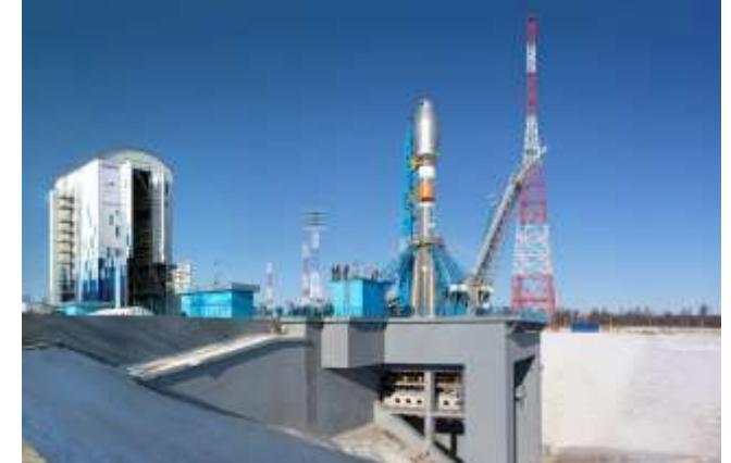
Космодром «Восточный», г. Циолковский