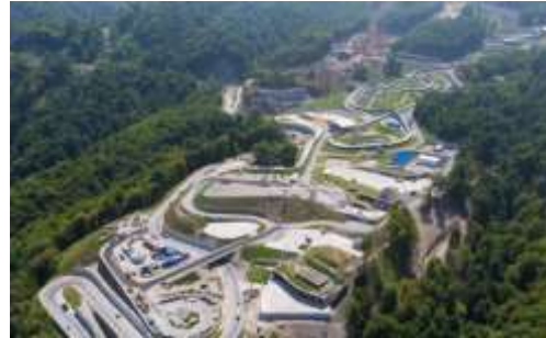
Санно-бобслейная трасса, г. Сочи